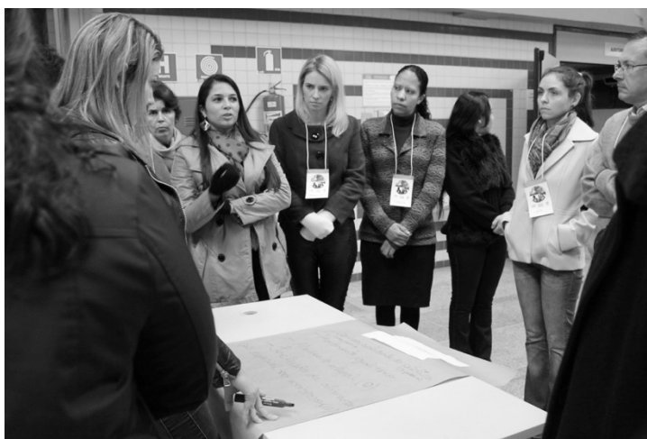
Figura 1- Formação de Atores Municipais para a Execução do PNAE